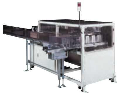
組付・段積み装置