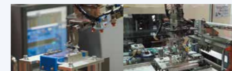
自動化機器の企画・設計・製作