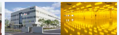
クリーンルーム完備のテクニカルセンター

豊富な実績や、ものづくりを支える環境、提案を支える人材について詳しくはHPをご覧ください。 >>> ユーシン インテグレーション